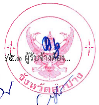
กรรมการและเลขานุการ