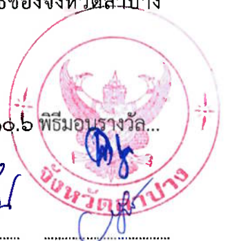
กรรมการและเลขานุการ