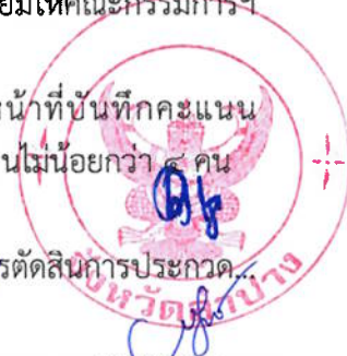
กรรมการและเลขานุการ