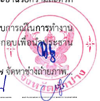
กรรมการและเลขานุการ