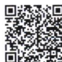
แนวทางการดำเนินกิจกรรม KM Challenge