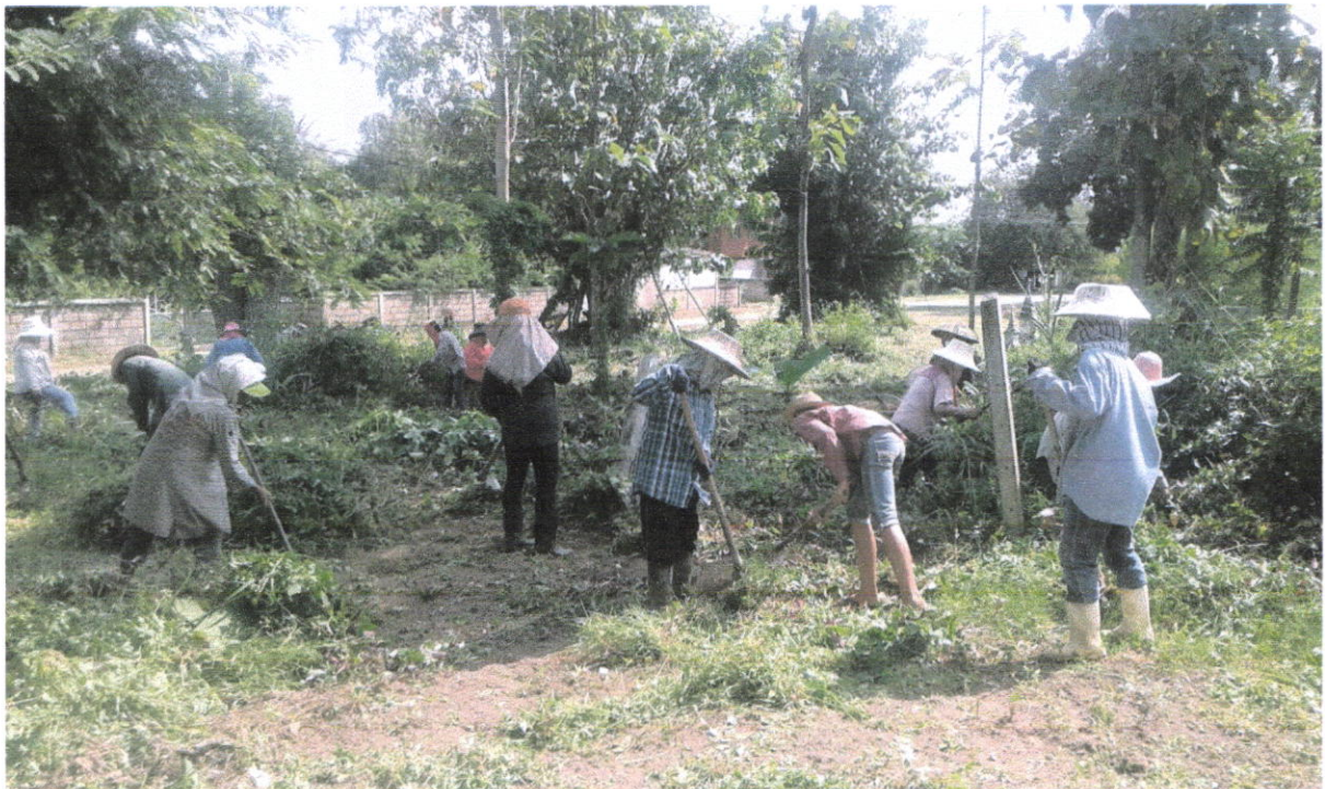
ขยายผลการดำเนินกิจกรรม ๕ ส สู่หมู่บ้าน/ชุมชน เป้าหมาย