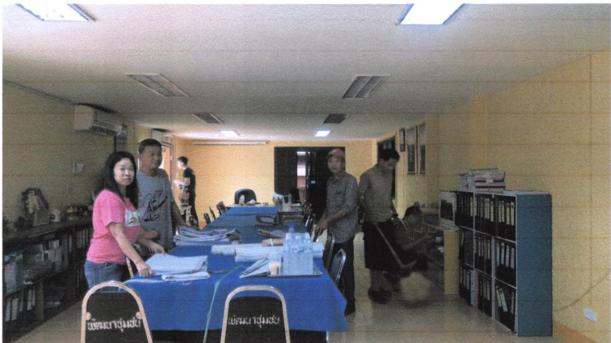
สำนักงานพัฒนาชุมชนอำเภอทุกอำเภอ ดำเนินการจัดกิจกรรม ๕ ส