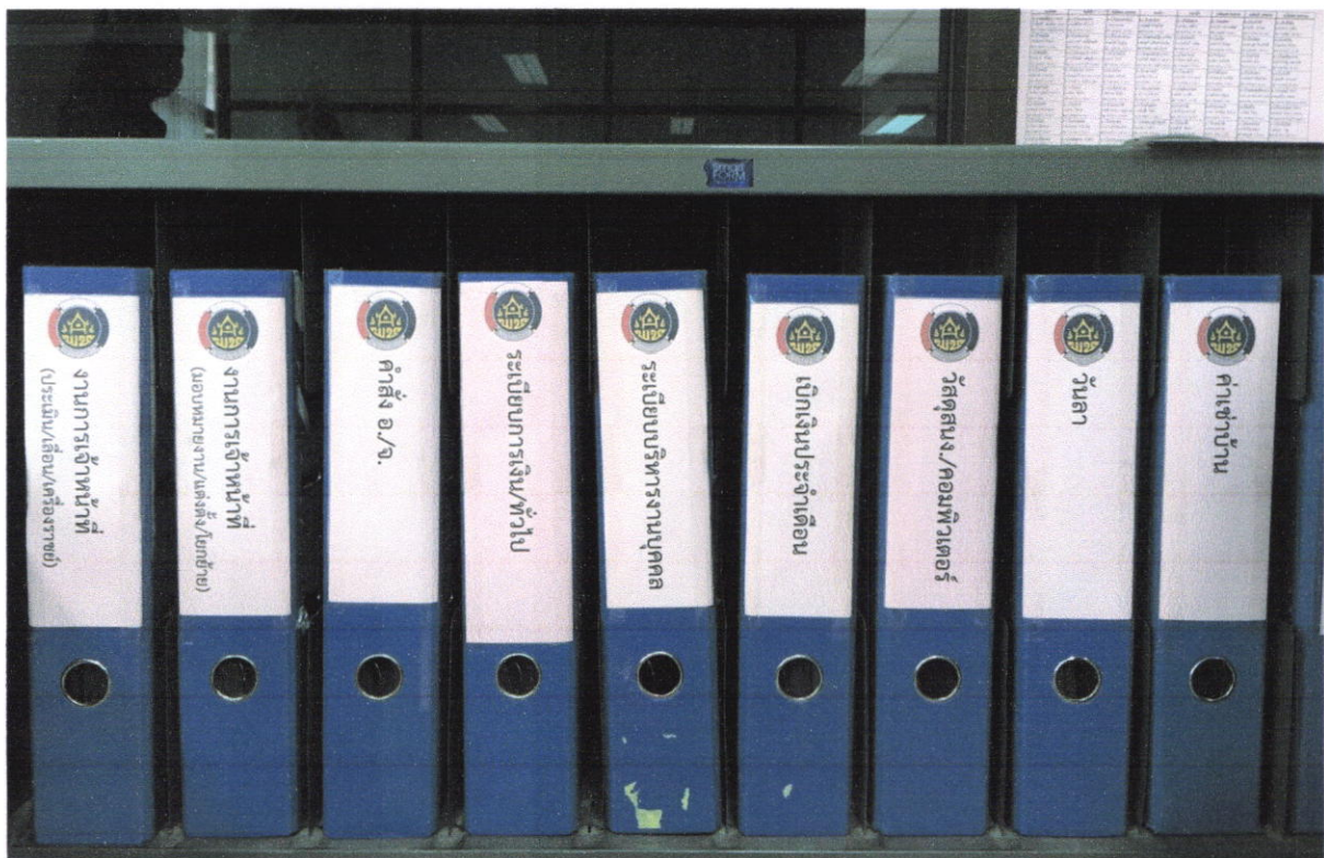
จัดเอกสารเป็นหมวดหมู่ สะดวกต่อการใช้งาน เป็นระเบียบเรียบร้อย