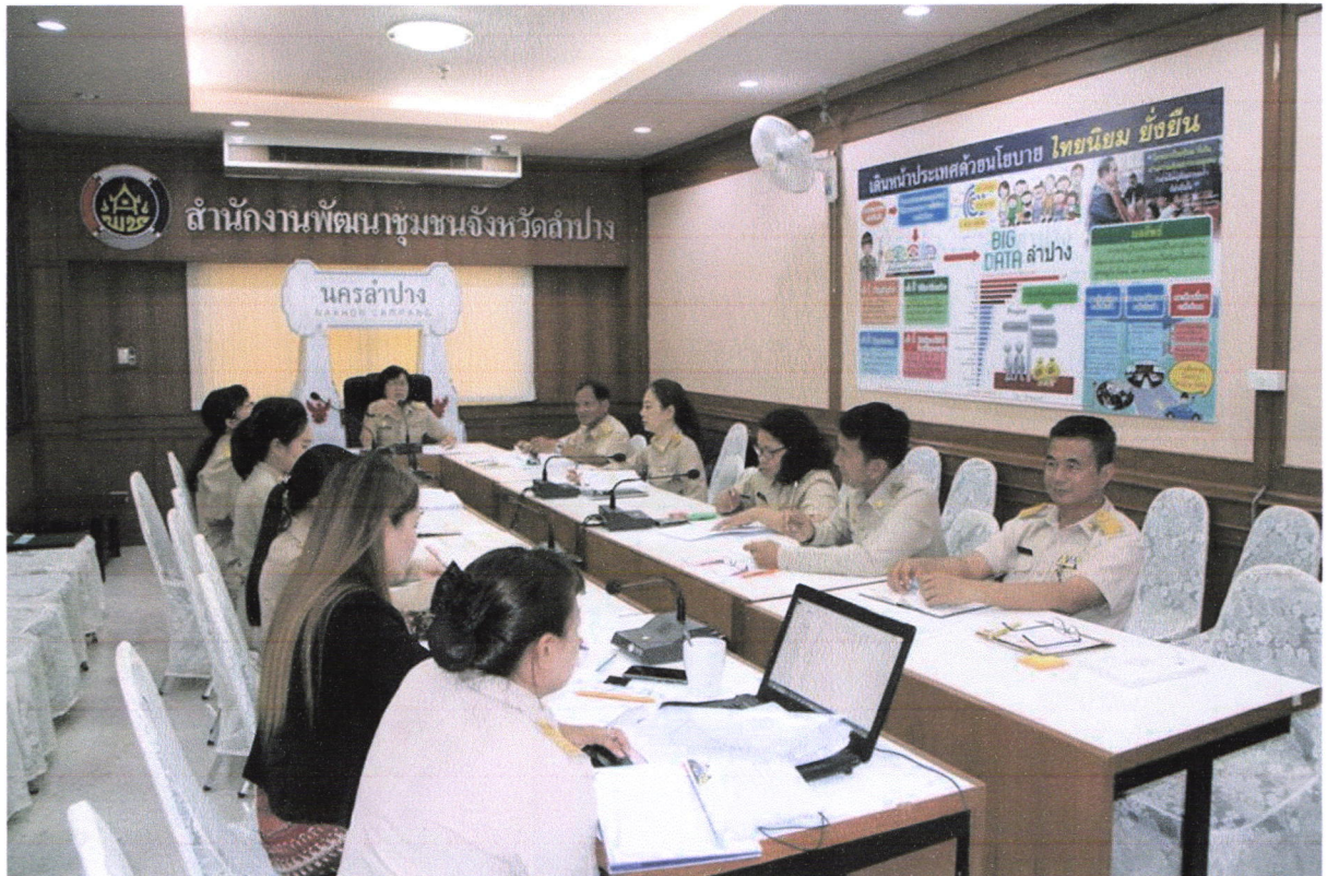
ประชุมวางแผนการขับเคลื่อนกิจกรรม ๕ ส