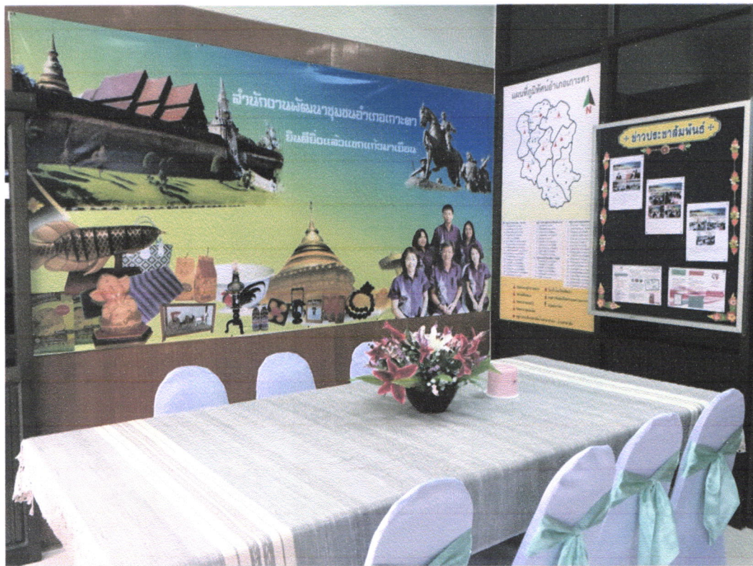
สำนักงานพัฒนาชุมชนอำเภอทุกอำเภอ สะอาด มีบรรยากาศที่ดี พร้อมให้บริการประชาชน